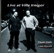
Live at Villa Irniger (2016)