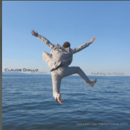
Nothing to Prove (2013)