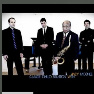
Claude Diallo Situation (feat. Andy McGhee) (2010)