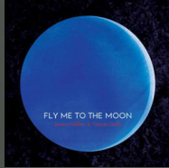
Fly Me to the Moon (2015)