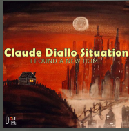
I Found A New Home (2020)