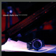
Live in Switzerland (2006)