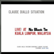
Live at No Black Tie: Kuala Lumpur, Malaysia (2011)