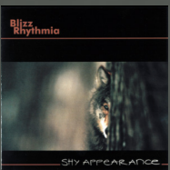
Shy Appearance (2001)