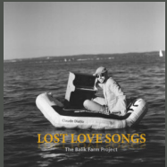
Lost Love Songs (The Balik Farm Project) (2014)