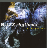
A Bientôt (2005)