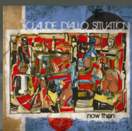
Now Then (2010)