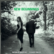
New Beginnings (2013)