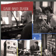
Motion in Progress (2013)