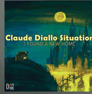
I Found A New Home (Vinyl) (2020)